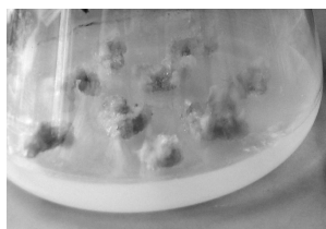
图 1 甘西鼠尾草愈伤组织 Fig. 1 Callus of S. przewalskii

素组合为 A_2B_3C_2 ; 以甘西鼠尾草愈伤组织相对生长速率为指标, 得到最佳的激素组合为 A_2C_4D_2 。