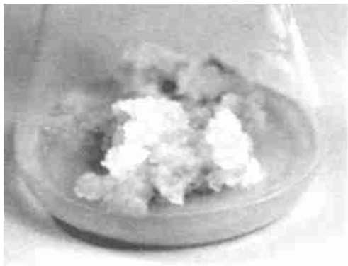
图 1 粉花绣线菊的愈伤组织

2.3 不同激素对比对愈伤的诱导: 用茎尖作外植体, MS为基本培养基, 附加不同配比激素组合, 培养 30 d, 诱导情况见表 3 从表中可看到: 激素对愈伤的形成有重要的影响。2,4-D对愈伤的形成有很强的诱导能力, 而 IAA, NAA 不能诱导出愈伤组织, 但较高的浓度的 2,4-D易使外植体严重褐化而死亡。KT对愈伤的诱导起重要作用, 但高浓度的 KT不利于愈伤的形成。因此, 2,4-D 2.0 mg/L和 KT 0.3 mg/L激素配比最适合愈伤的诱导(图 1)