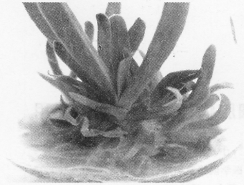
图4 莫邪菊试管苗的生根

培养基为MS0时生根效果好,且配方简单,节约成本。待根长至2.0~3.0 cm时,打开瓶盖,室内自然光照下炼苗1 d后可将小苗取出,用自来水冲洗掉附着在苗根部的培养基,再放入装有少量自来水的培养瓶中培养4 d,待小苗根部发出白色新根后移栽入沙土中培养,注意保持沙土的湿润,但空气湿度不能过大,且不能叶面喷水,否则叶片易腐烂(图5)。按此方法移栽的试管苗成活率可达95%。