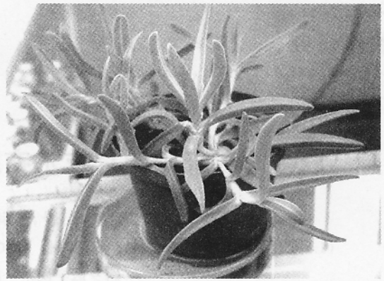
图5 莫邪菊试管苗的移栽

本试验结果表明:培养基配方为MS+2,4-D 2.0 mg/L+6-BA 0.2 mg/L时,种子破壳萌发率为70%,胚轴处愈伤组织诱导率为100%;MS+6-BA 2.0 mg/L为合适的丛生芽诱导和增殖培养基;培养基为MS0时生根率为95%,移栽的试管苗成活