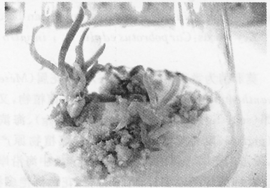
图2 莫邪菊丛生芽的分化