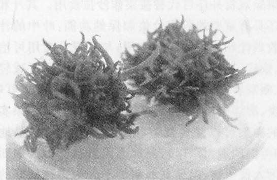
图3 莫邪菊丛生芽的增殖